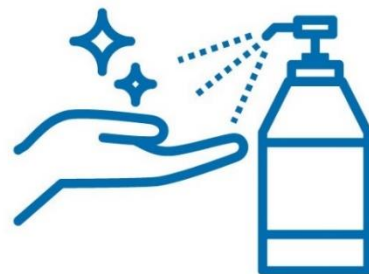
こまめに手洗い・ 消毒